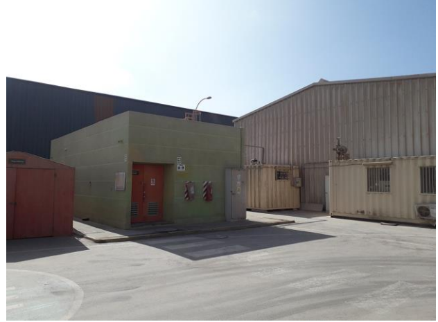
PATIO DE MANIOBRAS Y ALMACENAMIENTO