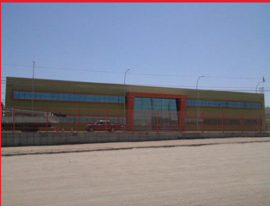
FACHADA DE EDIFICIO DE OFICINAS