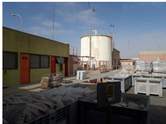
VISTA DEL PATIO CENTRAL

LAS IMÁGENES ILUSTRAN LAS CONDICIONES ACTUALES DE LA PROPIEDAD.