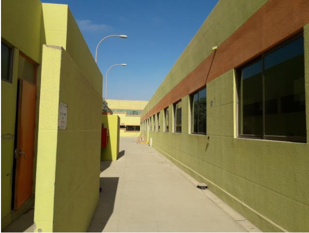
VISTA LATERAL DE LABORATORIOS