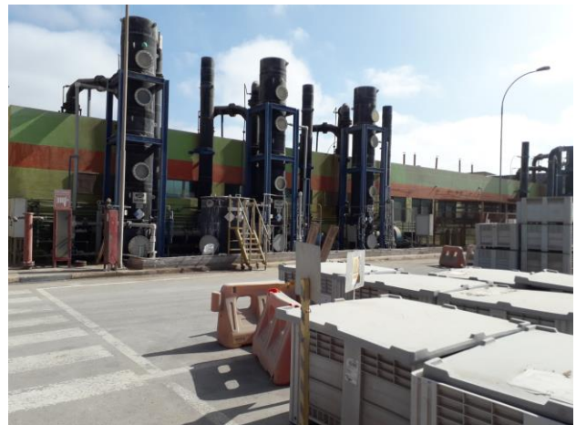
VISTA EXTERIOR DE LABORATORIOS