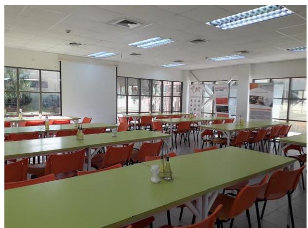
COMEDOR - CASINO